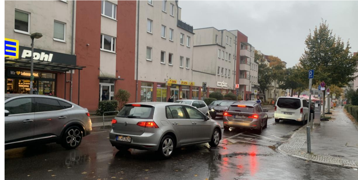
Stau im Bereich vielfrequenzierter Fußgängerquerung