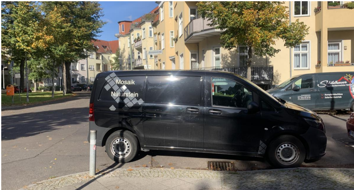
Parken in Kreuzungsbereich