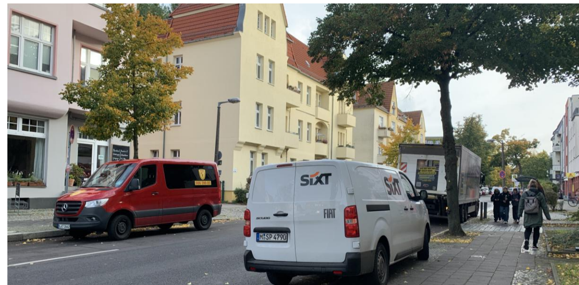
3 x Halten/Parken im abs. Halteverbot